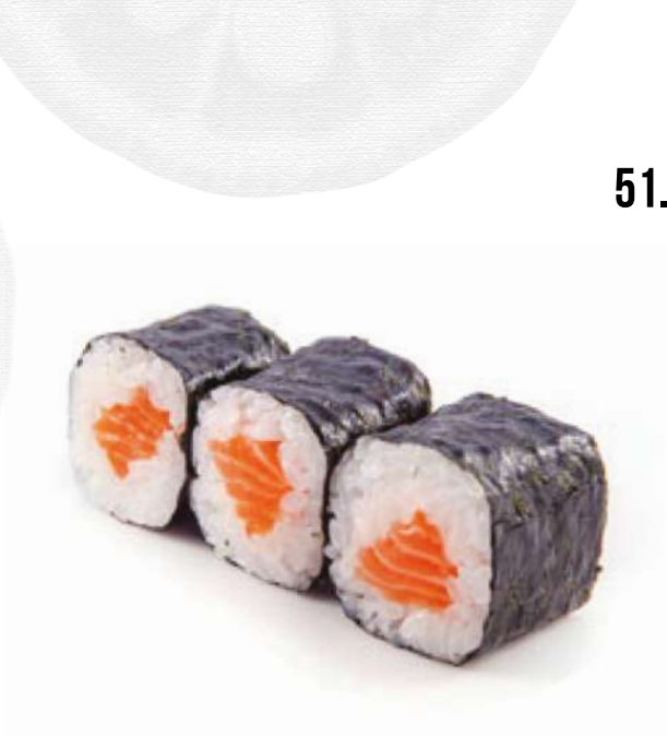
51. SAKE MAKI 4,50 € salmone